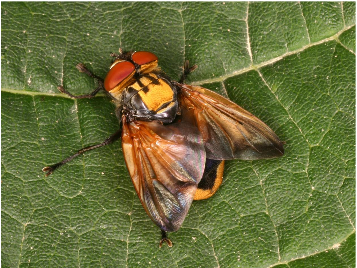
Abbildung 1. Männchen der Goldschildfliege