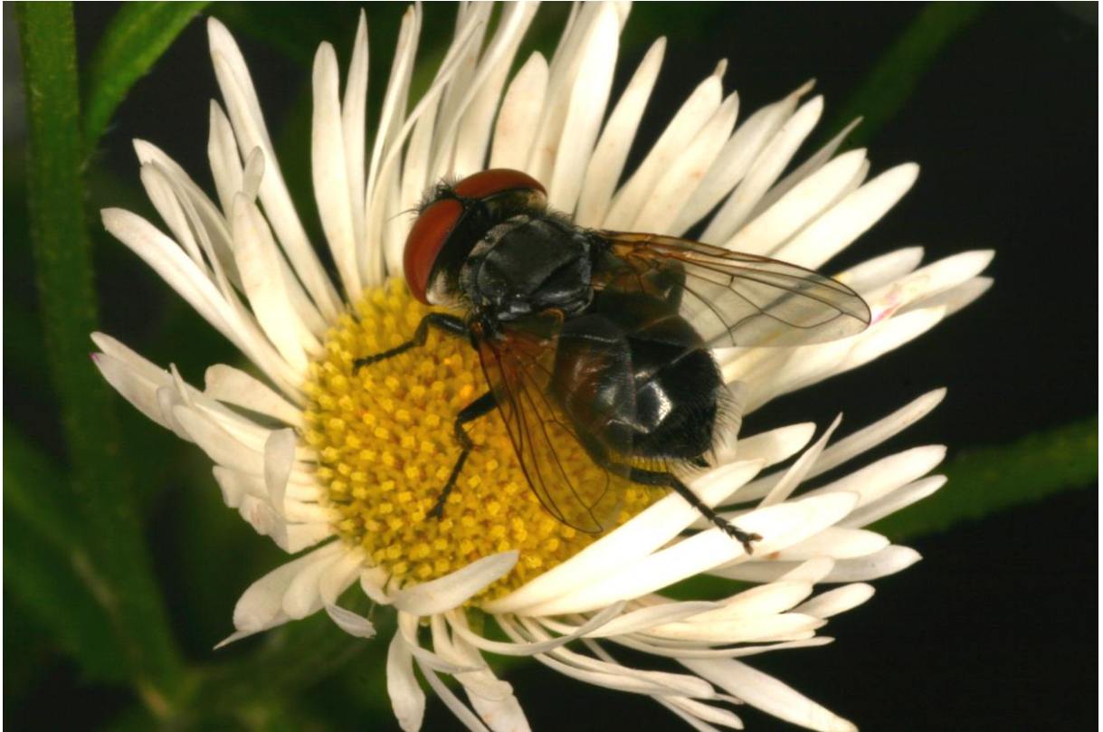
Abbildung 2. Weibchen der Goldschildfliege