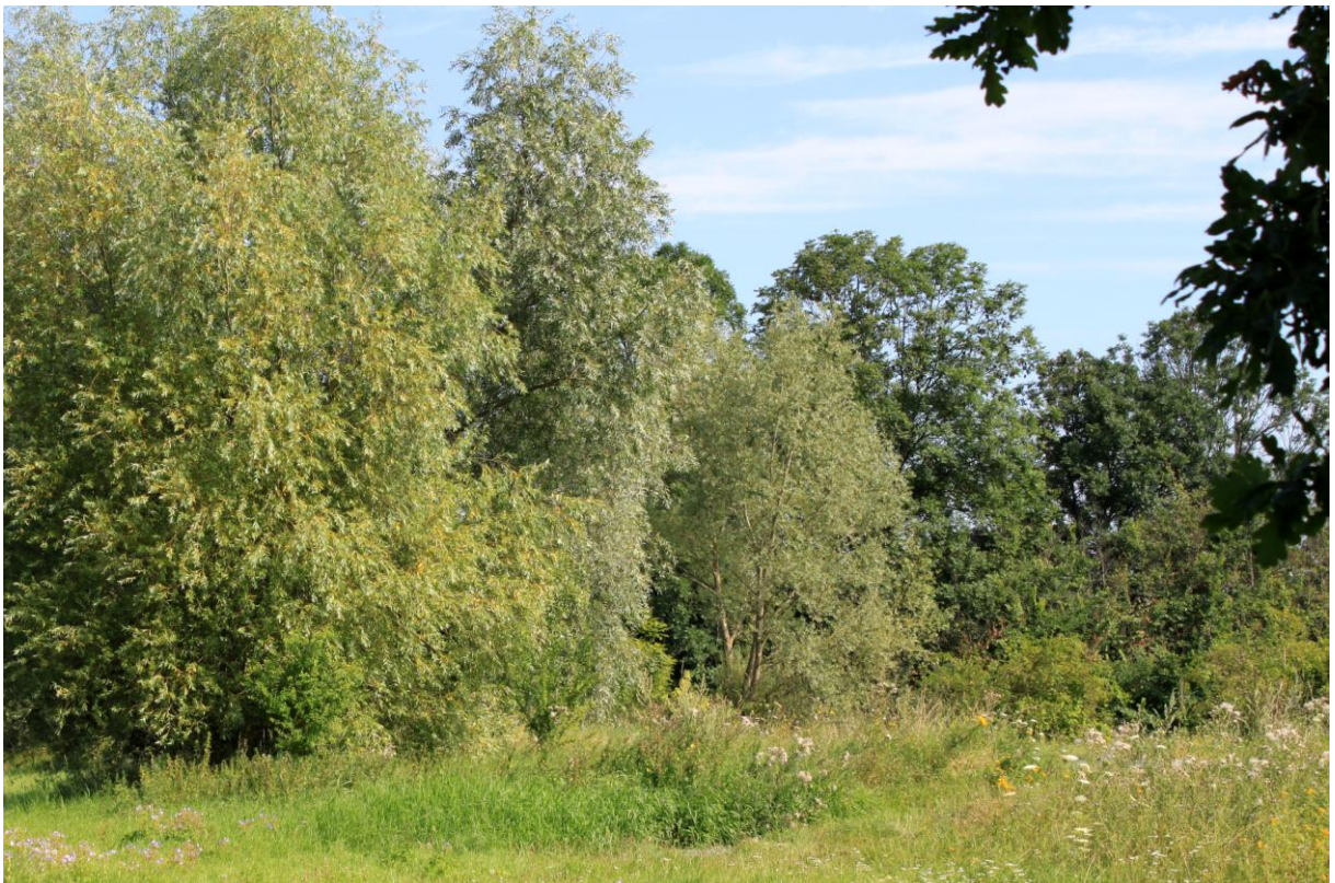
Abbildung 3. Waldrand und Hecken mit blühenden Kräutern sind der bevorzugte Aufenthaltsort der Goldschildfliege.

Dr. Wohlerth Wohlers Pressesprecher Kuratorium „Insekt des Jahres“ Tel. 0531 299 33 96 Sekretariat Tel 0531 299 32 05 pressestelle@jki.bund.de http://www.jki.bund.de > Presse > Insekt des Jahres